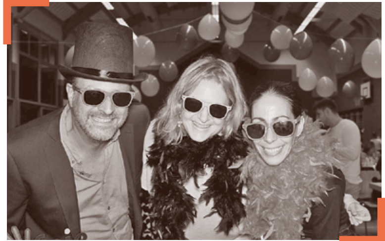
Trois membres du comité de direction de l'EFAJE à l'heure du photomaton convivial.