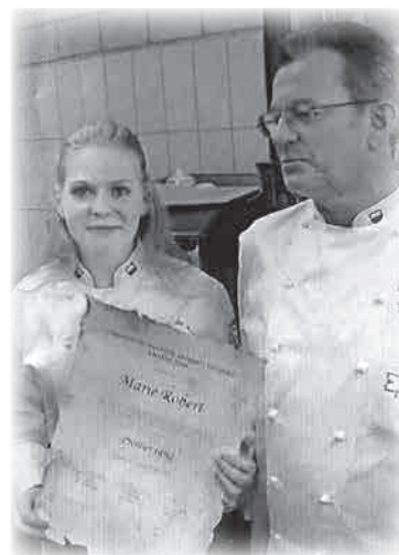
Meilleure apprentie cuisinière du canton.

Plutôt cette leçon que j'aime transmettre aux jeunes en difficultés et à leurs parents quand j'en ai l'occasion : ce n'est pas parce qu'on est une pive à l'école qu'on n'arrivera à rien dans la vie ! Moi, j'étais nulle dans toutes les branches et pourtant quand j'ai passé ma patente, j'ai eu la meilleure moyenne. En fait, quand on a trouvé ce qu'on a envie de faire de sa vie, toutes les barrières