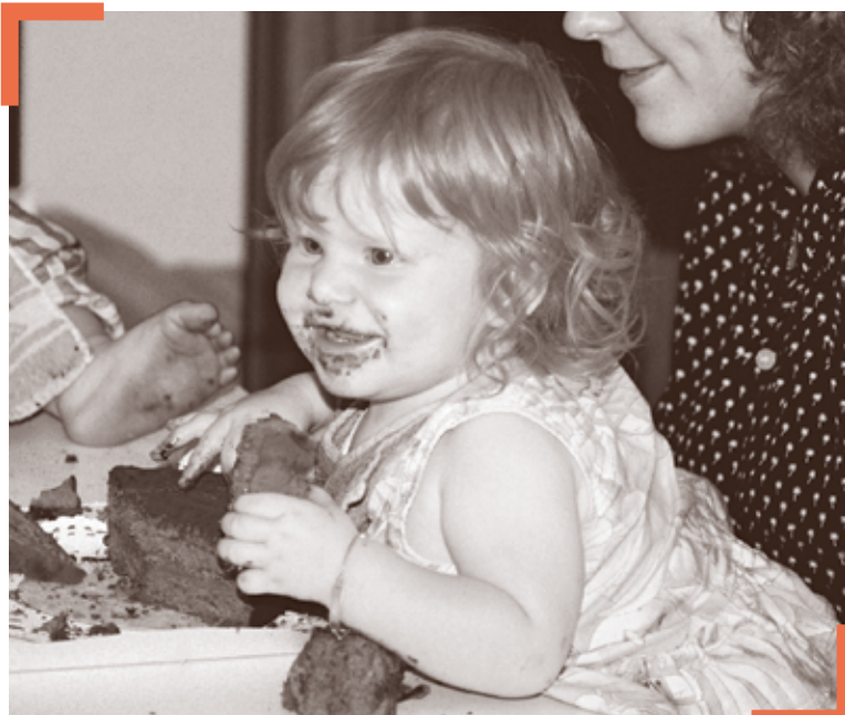
Gamine et gourmande avec sa maman.