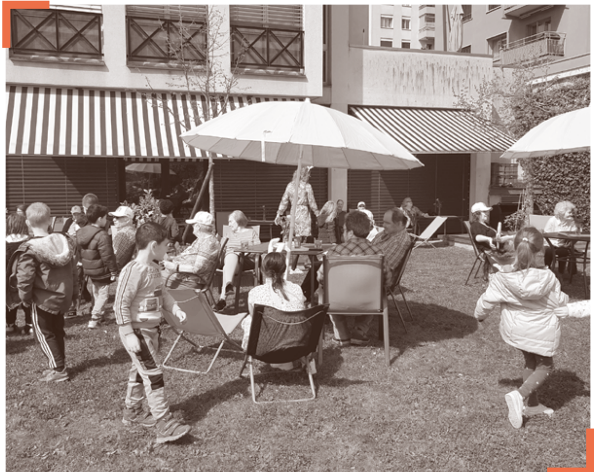
Les Centres d'accueil temporaire proposent différentes activités socio-culturelles ainsi que d'autres possibilités d'accompagnement.

Ces centres offrent des possibilités d'accompagnement souples et diversifiées, adaptées aux besoins de chacun : le temps d'un repas, une demi-journée, une journée entière ou, selon les institutions, pour une nuit voire tout un week-end. Ils visent à stimuler la réflexion des bénéficiaires et conserver un maximum d'autonomie. Des activités socio-culturelles diverses y sont proposées durant la journée : jeux, gymnastique, jardinage, cuisine, bricolages, sorties à des spectacles, balades, chant... les professionnels et les usagers des CAT ne manquent pas d'idée !