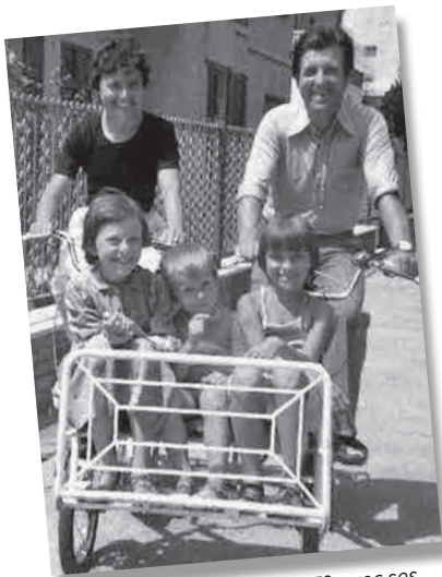
Vacances italiennes en 1979 avec ses parents et ses deux sœurs.