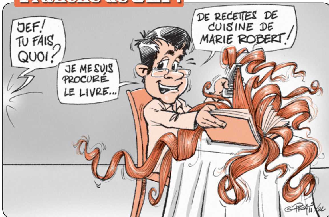
Lire notre grande interview page 1-3.